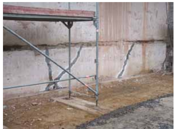
Die Kelleraußenwand wurde durch kraftschlüssige Verpressung der Risse wieder stabil belastbar.

Da es erforderlich war, die Unterzüge unter der Kellerdecke sowie die Kelleraußenwände statisch belastbar wiederherzustellen, wurden die in diesen Unterzügen bzw. Außenwänden befindlichen Risse „kraftschlüssig“ mit KÖSTER IN 3 verpresst. Dieses Harz ist eine Besonderheit: Als einziges „starres“ PU-Injektionsharz auf dem deutschen Markt ist es hinsichtlich seiner technischen Daten, z. B. Reißfestigkeit, Schubfestigkeit etc., den