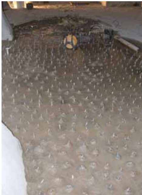
Bei den Bodenflächen werden zur Injektion KÖSTER Packer montiert.