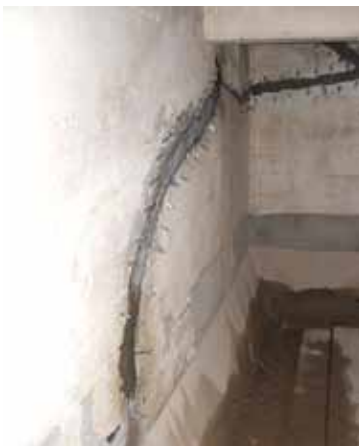
Die Risse sind mit KÖSTER KB-Fix 5 verdämmt, die Packer zum Verpressen sind in der Wand und im Übergang Sohle/Wand montiert.

In einigen Sonderfällen ist es dagegen erforderlich, die Statik eines gerissenen Betonteils