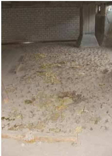
Nach erfolgreicher Injektion fällt der Boden trocken.

herkömmlichen Epoxidharzen deutlich überlegen. Dazu kommt die bei einem PU-Injektionsharz übliche unkomplizierte Anwendbarkeit in feuchten Rissen, die für Epoxidharze immer problematisch ist.