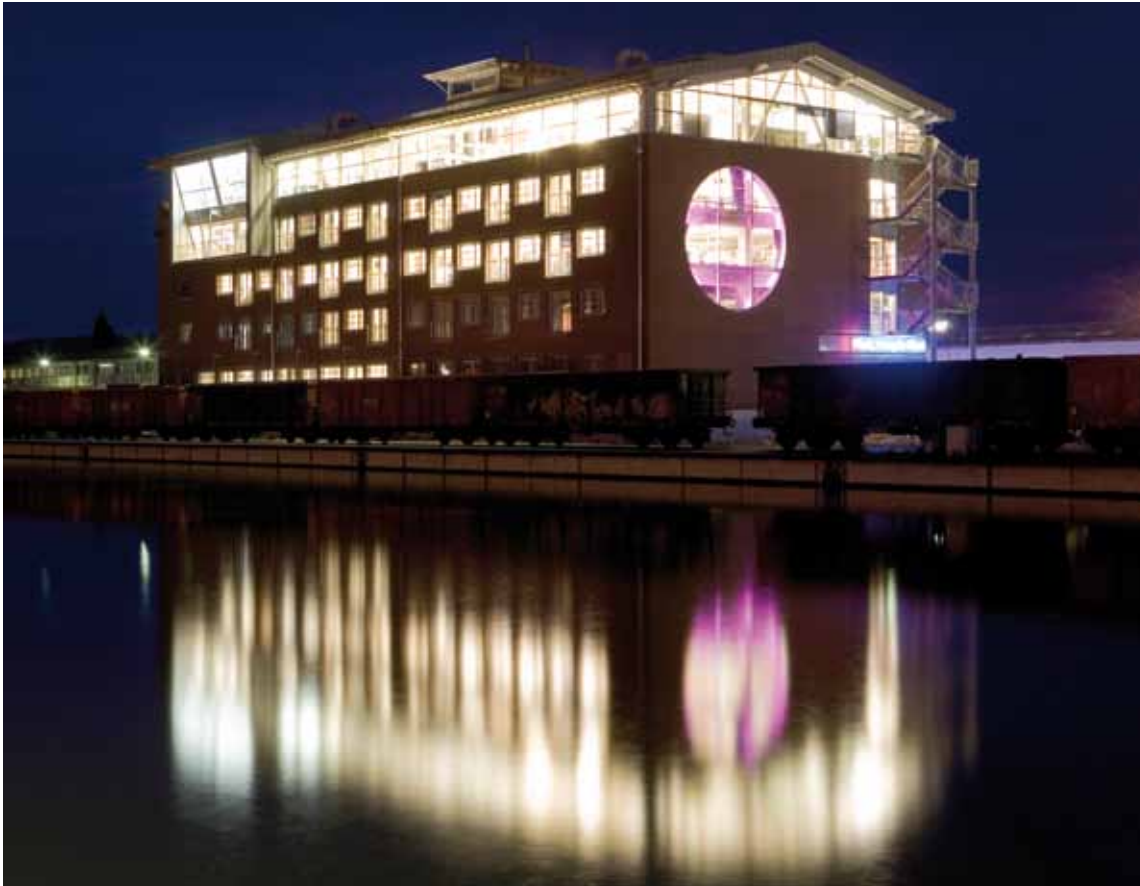
Direkt am Osnabrücker Stadthafen: der zu einem Bürogebäude umgenutzte Getreidespeicher

wasserdichten Verschluss der Risse gewährleisten kann, z. B. KÖSTER 2 IN 1.